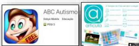
Exemplos de aplicações para sistemas android e iOS

A terapia da fala não é exceção nesta influência de tendências, deixando-se interetar pela tecnologia ao criar aplicações direcionadas para diversas problemáticas (e.g. apraxia, afasia, fluência, leitura e escrita), também em diversas línguas. Em português, já se podem encontrar aplicações para a reabilitação e promoção de competências linguísticas orais e escritas.