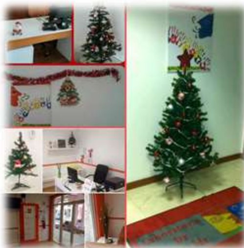
Labfala Póvoa de S ra ria/Odivelas/S ra Marta do Pinhal

Já é oficial a época do ano em que os pinheiros ocupam o chão das nossas salas e os doces começam a preencher as nossas mesas.